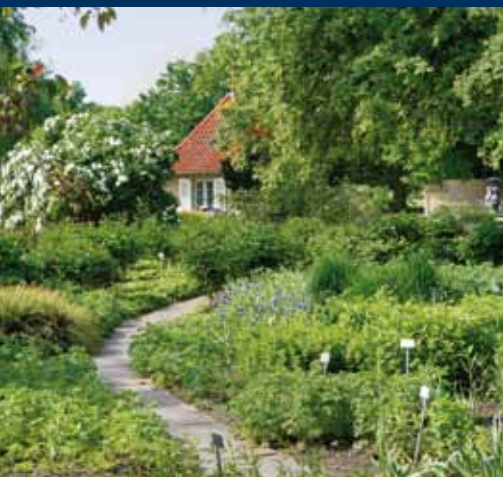
Die Freundschaftsinsel mit dem Torhaus.