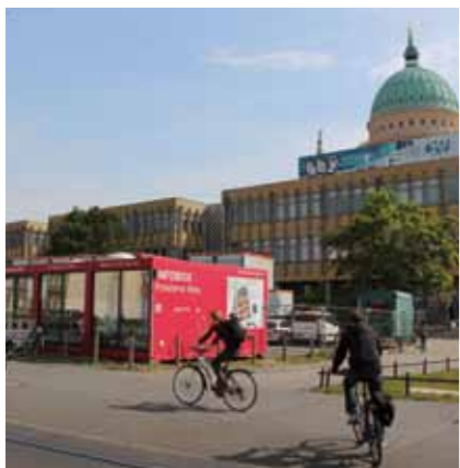
Infobox Potsdamer Mitte.

Ende April ist der Startschuss zum Potsdamer Bürgerhaushalt gefallen. Nach einer umfangreichen Ideensammlung geht es nun um eine Vorauswahl der wichtigsten Bürgervorschläge für die Planung der Stadtfinanzen. Bis zum 10. Juni können sich Potsdamerinnen und Potsdamer daran beteiligen.