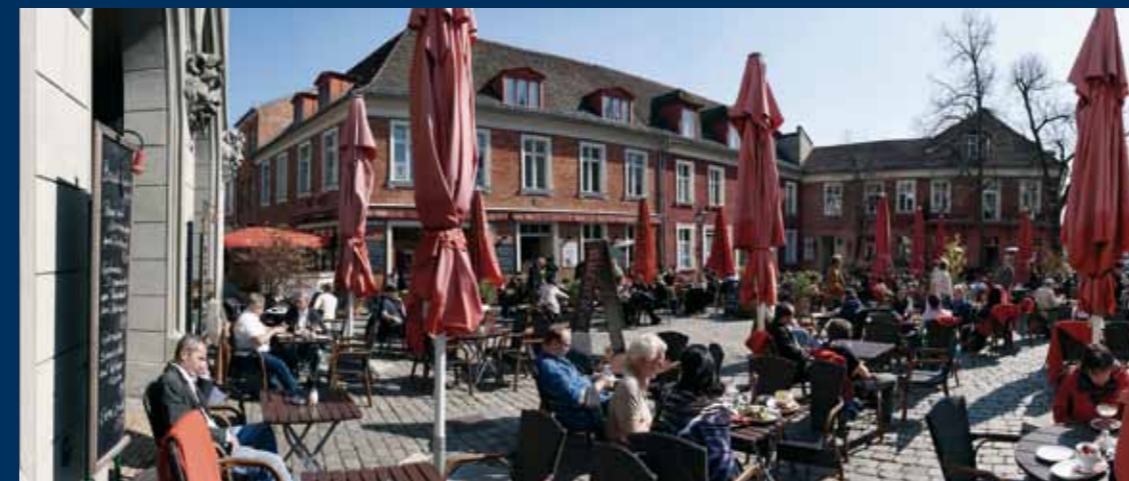
Potsdams Mitte ist ein Touristenmagnet, das gilt nicht nur für das Holländische Viertel.