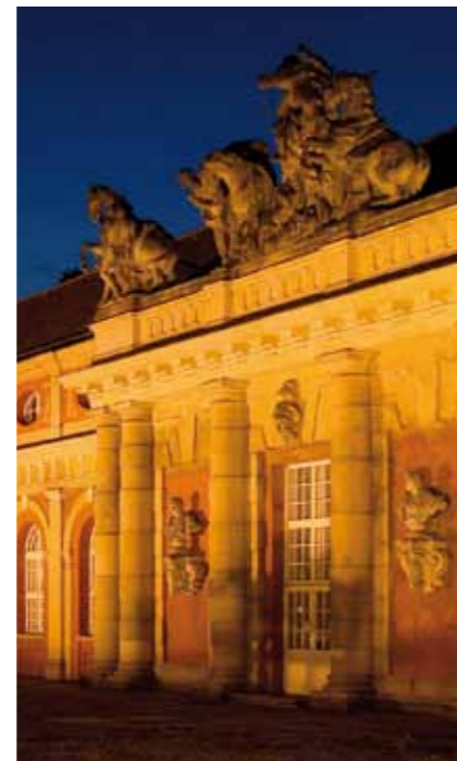
Ein Lichtkonzept für die Landeshauptstadt Potsdam wird die Verwaltung auf Beschluss der Stadtverordnetenversammlung erarbeiten und den Fraktionen vorlegen. Die nächste Sitzung der Stadtverordneten findet am Mittwoch, 1. Juni 2016, ab 15 Uhr im Plenarsaal des Rathauses statt.

Bis Mitte Mai haben (hoffentlich) viele Bürger*innen die Möglichkeit genutzt, Anregungen, Bedenken und Widerspruch gegen die Neufassung der Potsdamer Baumschutzverordnung einzulegen. Nun wird eine Weile verwaltungsintern geprüft und abgewogen, ob und welche Hinweise berücksichtigt werden. Dann entscheiden die Stadtverordneten, welchen Stellenwert der Baumschutz in Potsdam künftig noch hat. Dürfen künftig Baumriesen in Parks und in der Nähe von Wohnhäusern ohne Antrag und Ersatzpflanzung gefällt werden? Sind Bäume unter 60 cm Stammumfang ungeschützt? Auch wenn die offizielle Beteiligung der Bürgerschaft inzwischen vorbei ist, können Sie Einfluss auf diese Fragen nehmen. Wir möchten Sie ausdrücklich ermuntern, alle Möglichkeiten zu nutzen. Gerade in einer wachsenden Stadt mit reger Bautätigkeit ist es wichtig, dass Bäume effektiv geschützt werden und dass kein Stadtgrün ohne Ersatz einfach verschwindet.