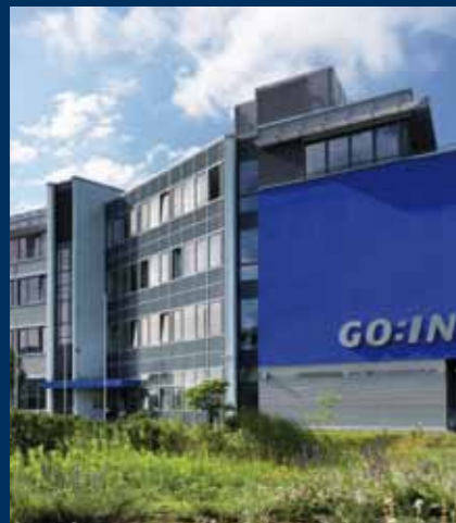
Eine Erfolgsgeschichte: das Wissenschaftszentrum GO:IN in Golm.