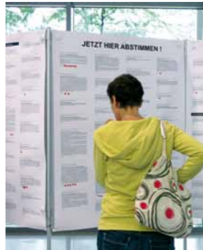
Beteiligung beim Haushalt.

In einer ersten Phase waren bis zum 29. Mai alle aufgerufen, eigene Ideen und Vorschläge für die Gestaltung der Stadtfinanzen zu unterbreiten. Viele Potsdamerinnen und Potsdamer haben diese Möglichkeit genutzt und bei der Vorschlagsammlung hunderte Ideen zur Finanzplanung des Jahres 2017 genannt. Die meisten Hinweise beziehen sich konkret auf Themen der Stadt- und Verkehrsentwicklung sowie auf Forderungen zur Kindertagesbetreuung in Potsdam. Auch kreative Wünsche wie eine Bewerbung Potsdams als Austragungsort der Olympischen Spiele finden sich unter den Bürgervorschlägen. Daneben wurden Tipps gegeben, wie Potsdam aus Bürgersicht steigende Ausgaben finanzieren könnte. Hierbei werden beispielsweise die Einführung einer „City-Maut“, die Erhöhung von Bußgeldern oder die Erhebung neuer Steuern vorgeschlagen. Dazu zählen die Einführung einer „Katzentaxi-“ oder „Soziale-Stadt-Steuer für Investoren“.