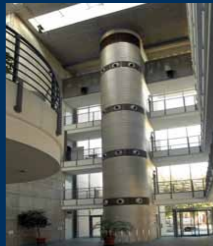
Potsdam ist Filmstadt: das FX-Center in Potsdam Babelsberg.