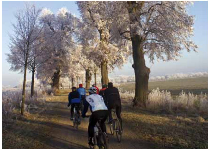
Radfahren in der Lennéschen Feldflur: Neue Radwege in Nachbarkommunen gehören zum Konzept des Stadt-Umland-Wettbewerbes.

Zu Beginn des diesjährigen Wintersemesters hat Oberbürgermeister Jann Jakobs die neuen Studierenden der Universität Potsdam bei der Erstsemesterparty im Waschhaus begrüßt. Bisher erhielten mehr als 3000 Bachelor-Studierende eine Zulassung an der Potsdamer Uni, bei den Masterstudiengängen sind es bereits mehr als 400. „Die Universität Potsdam ist eine wichtige Hochschuleinrichtung der Landeshauptstadt und ein Aushängeschild der wissenschaftlichen Forschung“, sagte Jakobs. An den vier Hochschulen in Potsdam sind im vergangenen Wintersemester 24.582 Studierende eingeschrieben gewesen. Die größte ist die Universität mit 20.411 Studierenden, gefolgt von der Fachhochschule mit 3404 Studentinnen und Studenten. sz