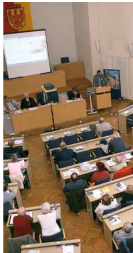
Der Plenarsaal der Stadtverordnetenversammlung im Rathaus Potsdam.

Um in der derzeitigen Flüchtlingsdebatte zu einer politischen Lösung zu kommen, bedarf es der Ehrlichkeit und Klarheit, gerade auf der Ebene des Verbalen. Wenn nun der Herr Oberbürgermeister auf dem SPD-Kreisparteitag unlängst erklärte, „man“ müsse die Ängste der Bürger angesichts der Flüchtlingskrise ernst nehmen und lapidar feststellt, Potsdam nähere sich einer „westdeutschen Normalität“ an, ohne dabei Erläuterungen nachzureichen, was er darunter versteht, so ist „man“ versucht zu fragen: „Fein. Und nun?“ Zwar bewegt sich Jakobs rhetorisch grazil durch emotional stark vermintes Gelände; die nötige Klarheit aber – die Klarheit über das inhaltlich Gemeinte ebenso wie die Klarheit und Konsequenz im Handeln – lässt auch er vermissen. An seiner Ehrlichkeit und Integrität besteht kein Zweifel. Die derzeitige Lage aber gebietet es allemal, die Dinge endlich beim Namen zu nennen, statt sich im gewohnt nebulösen „Politikersprech“ zu verlieren.