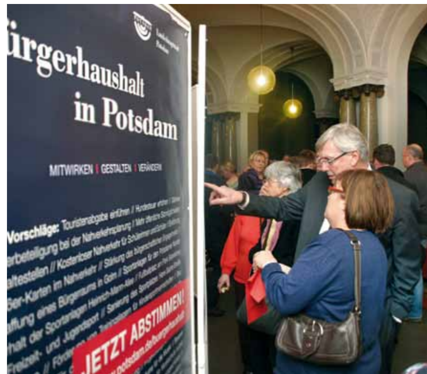
Bürger machen ihre Vorschläge zum Haushalt: Bereits zum zehnten Mal startet das Verfahren, bei dem sich alle Menschen aus Potsdam einbringen können. Mehr als 10 000 beteiligten sich beim letzten Mal.