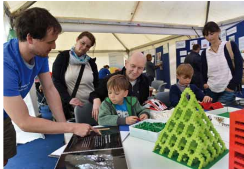
Wissenschaft zum Anfassen und Verstehen: Am 21. Mai ist wieder Tag der Wissenschaften in Potsdam, in diesem Jahr auf dem Campus der Filmuniversität.

In diesem Jahr investiert Potsdam mehr als 1,3 Millionen Euro in den Radverkehr. Schwerpunkte sind Planungen und der Bau von neuen Strecken, Fahrbahnverbreiterungen für Radfahrstreifen und Schutzstreifen oder die Erneuerung und Ergänzung von Markierungen. Hinzu kommen die reguläre Ausbesserung von schadhafte Radwegen oder die Straßenreinigung und der Winterdienst für Radwege. Ein Schwerpunkt besteht in dem Ausbau und der Verbesserung der Abstellsituation für Fahrräder an den Bahnhöfen und S-Bahnhöfen. So soll das Umsteigen auf Verkehrsmittel des Umweltverbundes und auch das Verknüpfen verschiedener öffentlicher Verkehrsmittel, zum Beispiel von Regionalbahn, S-Bahn, Straßenbahn und Bus, mit dem Fahrradfahren erleichtert werden. sz