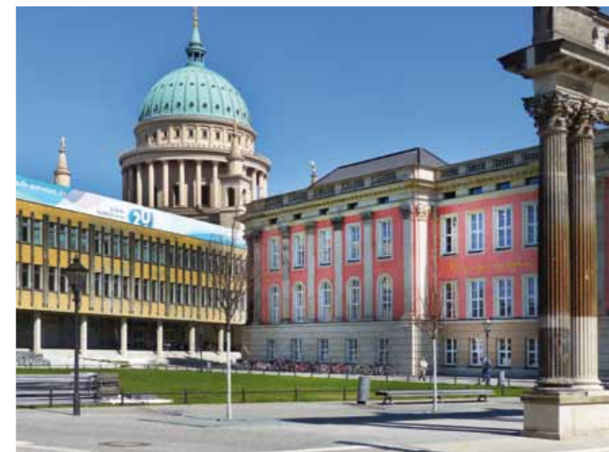
Wo heute die Fachhochschule steht, könnte ab 2021 gewohnt werden.