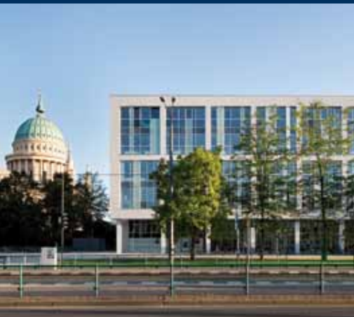
Bildungsforum Potsdam.

Online ist es nachzulesen unter www.potsdam-vhs.de . Für Kurse kann man sich im Internet, per E-Mail oder persönlich anmelden.