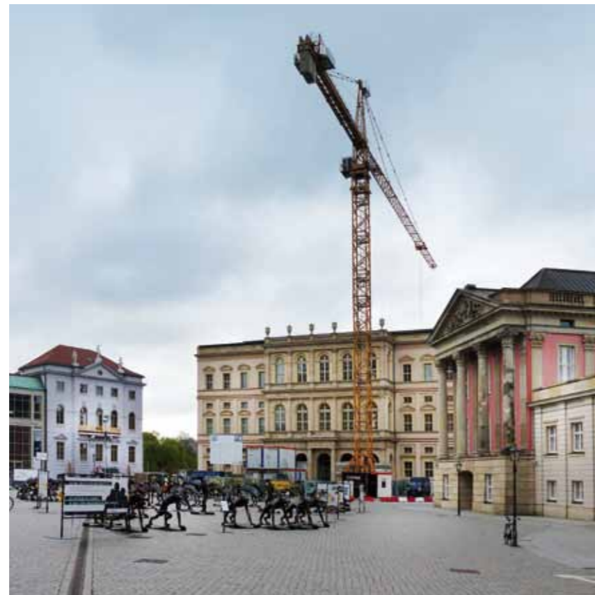
Potsdamer Mitte.

Das Leitbautenkonzept und der historische Grundriss zeigen erste Früchte und lassen erahnen, wie Potsdam davon profitieren wird. Mit dem Palast Barberini, der Uferpromenade Alte Fahrt, der Rückkehr der Ringerkolonade an ihren historischen Platz und nicht zuletzt dem Stadtschloss zeigt Potsdam eindrucksvoll, wie einladend die Mitte schon jetzt ist. Die Mitte hat das Potential, Potsdam noch attraktiver zu machen. Wer heute vor dem Fortunaportal steht und sich vorstellt, dass es tatsächlich Anstrengungen gibt, das FH-Gebäude und den Staudenhof zu erhalten, wird sich schwer tun, dafür Gründe zu finden. Diese Idee verhindert die Weiterentwicklung unserer Stadt und stellt viele demokratische Entscheidungen in den vergangenen 25 Jahren auf den Kopf. Unter dem Deckmantel eines demokratischen Bürgerbegehrens soll hier die Uhr zurückgedreht werden. Besorgte Menschen aus ganz Deutschland fragen nach, ob die Potsdamer das wirklich ihrer Stadt und den kommenden Generationen antun wollen.