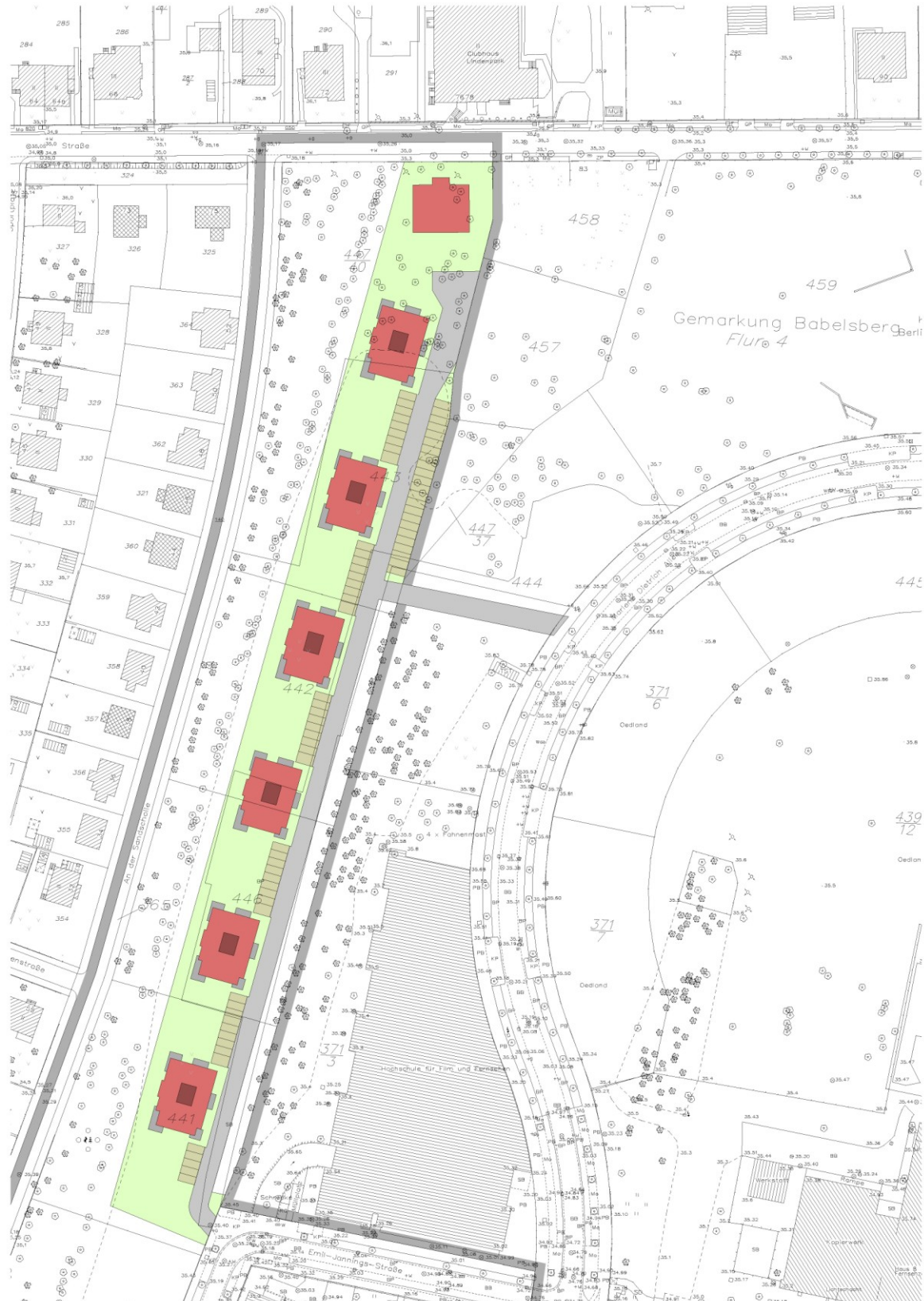
Städtebauliches Konzept zur Wohnbebauung; Entwurf BAU ART, Stand: 26. Mai 2011