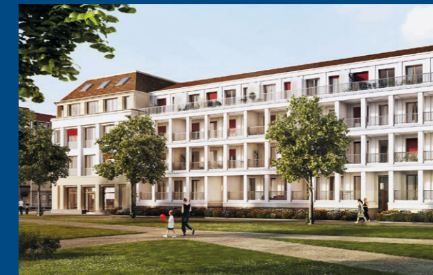
Westpalais an der Yorkstraße und 1. BA Langer Stall an der Plantage

Nach 23 Jahren Leerstand beginnen 2014 die Bauarbeiten zum denkmalgerechten Umbau des Palais für Wohnnutzungen. Zusammen mit der Errichtung der Stadthäuser östlich und westlich des Palais sowie dem 1. Bauabschnitt des Langer Stalls entstehen auf dem Grundstück ca. 100 Wohnungen.