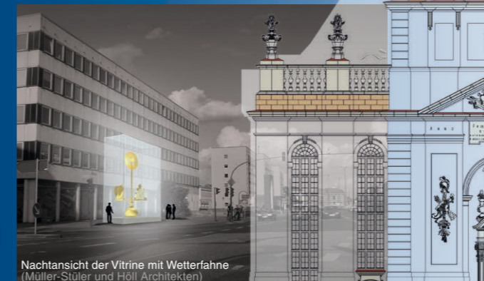
Nachtsicht der Vitrine mit Wetterfahne (Müller-Stüler und Höll Architekten)

Parallel zu den beginnenden Bauarbeiten am Kirchturm wird die bereits fertiggestellte Wetterfahne der Garnisonkirche an der Kreuzung Breite Straße und Dortustraße aufgestellt. Die neun Meter hohe und ca. 1,2 Tonnen schwere Wetterfahne wurde entsprechend des historischen Originals hergestellt und wird vorerst in einer Metallvitrine ausgestellt, bis sie nach Fertigstellung des Kirchturms an ihren endgültigen Platz, die Kirchturmsspitze, gehoben wird.