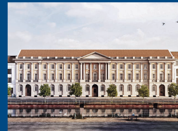
Brockesches Palais, Ansicht vom Stadtkanal/ Yorkstraße (Abbildung: Brockesches Palais Grundbesitz GmbH)