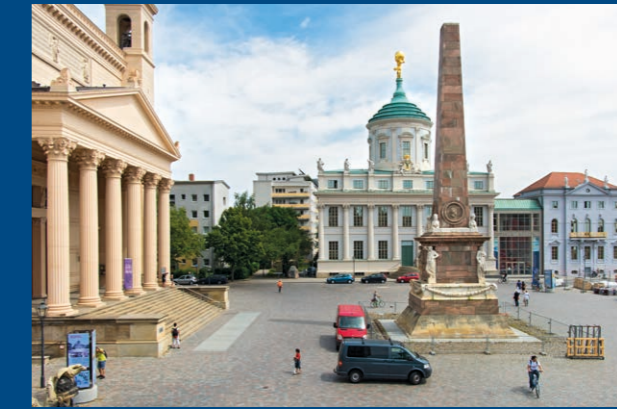
Potsdam Museum im Alten Rathaus Ausstellung im Potsdam Museum