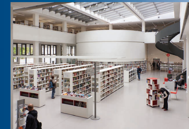
Bildungsforum Potsdam

Seit September 2013 lädt das Museum in die ständige Ausstellung „Potsdam. Eine Stadt macht Geschichte“ ein. Auf einer Fläche von 800 m 2 kann die über 1000-jährige Potsdamer Geschichte entdeckt werden. Elf Themen zeichnen ein lebendiges Bild von den Anfängen als unbedeutendes Nest im Mittelalter über die barocke Residenzstadt bis zur Gegenwart als Landeshauptstadt Brandenburgs. 500 Objekte aus den Bereichen Kultur- und Alltagsgeschichte, Militaria, Kunst und Fotografie erzählen vom Leben in der Stadt. Interessante Medienstationen bieten zusätzliche Informationen. Das Begleitprogramm, für jede Altersgruppe hält weitere spannende Angebote bereit.