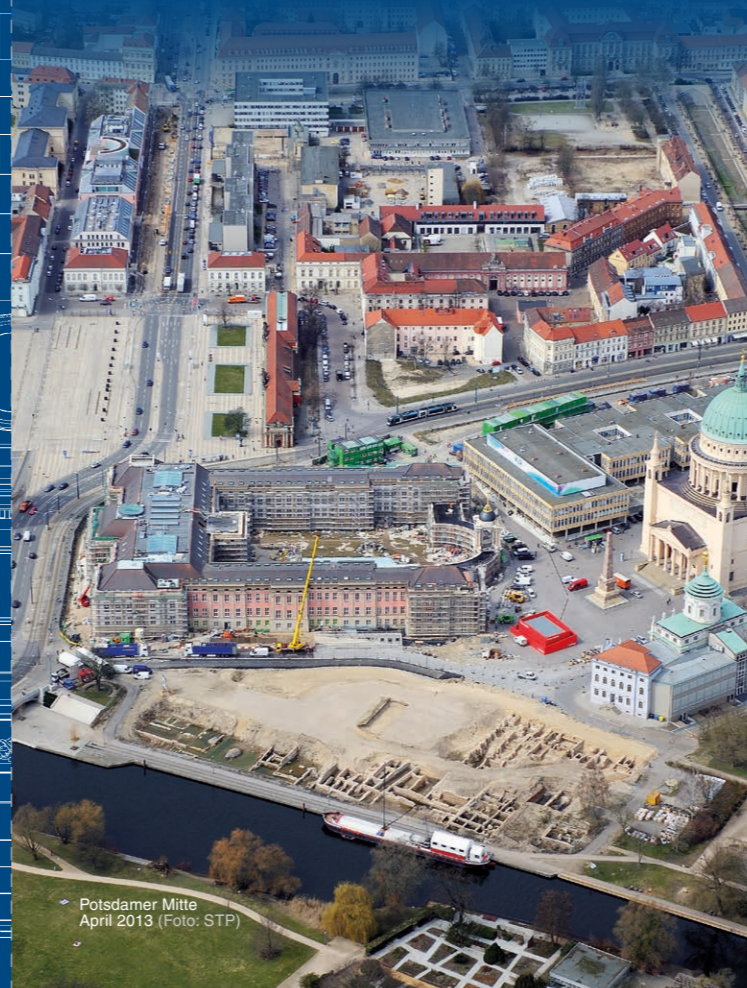
Potsdamer Mitte April 2013

Die Uferpromenade ist Bestandteil des Uferweges von der Schiffbauergasse bis zur Speicherstadt und Hermannswerder bzw. bis zum Luftschiffhafen. Das Ergebnis des Wettbewerbs wird der Öffentlichkeit im Sommer 2014 vorgestellt.