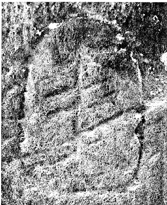
Abb. 3: Steinmetzzeichen am Kronenkissen.

Die Schäden am Naturstein waren gravierend. Wesentliche Formenverläufe waren nicht mehr nachvollziehbar. Die Gipskrusten unterschiedlicher Stärke und Verschwärzungen