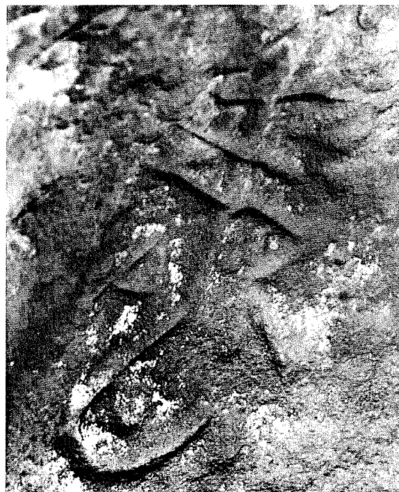
Abb. 4: Steinmetzzeichen auf der Rückseite der Krone.