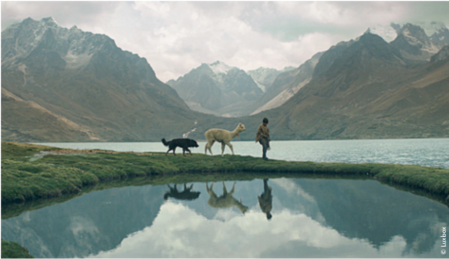
Rambo, Ronaldo und Feliciano – enge Freunde im Film Raíz ( Through Rocks and Clouds ).

Potsdams, nicht weit entfernt von den Babelsberger Filmstudios. Potsdam ist ein führender deutscher Wissenschaftsstandort, an dem unter anderem Klima- und Meeresforschung auf Weltniveau betrieben wird. Es liegt also nahe, dass GREEN VISIONS POTSDAM an diesem Ort Film und Wissenschaft verbindet. Alle Filmvorführungen des Festivals werden von Publikumsgesprächen begleitet. Dabei diskutieren Wissenschaftler:innen und Filmschaffende über Umweltthemen.