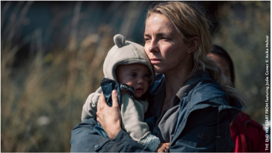
THE END WE START FROM featuring Jodie Comer